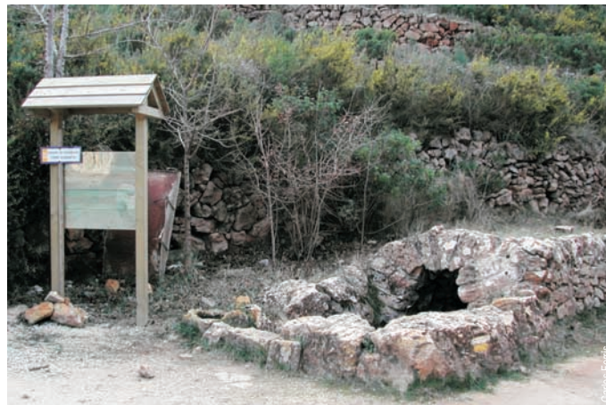
Font Coberta, Pedreguer

Pedreguer, enlace con PRV 53.1 - Cueva del Tambor - Caseta Romangat - Font Coberta - Fuente del Rull - Pla de l'Era, enlace con variante PRV 53. 1 - Barranco de l'Aigua - Fuente d'Aixa, enlace con PRV 53.2 - Barranco de la fuente d'Aixa, enlace con PRV 53.3 - Penyes Blanques - Castillo d'Aixa, enlace con PRV 53.3 - Fonteta de la tia Xima - Fuente de l'Ocaive - Cueva, enlace con PRV 53.4 - Fuente de l'Ombreta, enlace con PRV 53.3 - Pedreguer.