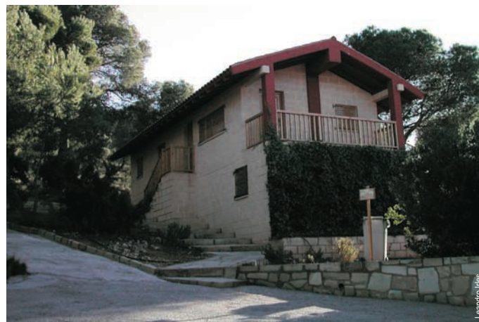
Alberg Tresfontes, Pinoso