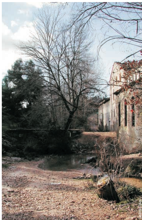
Riu Vinalopó y fábrica de Blanes, Banyeres de Mariola

entidad promotora: C. Excursionista de Penya Roja