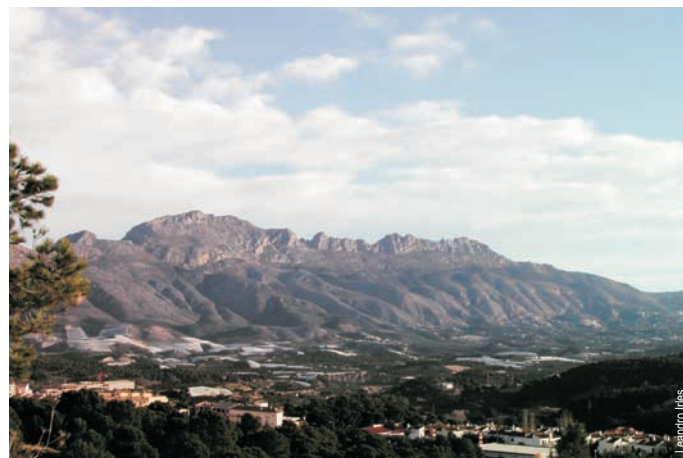
Sierra de Bèrnia