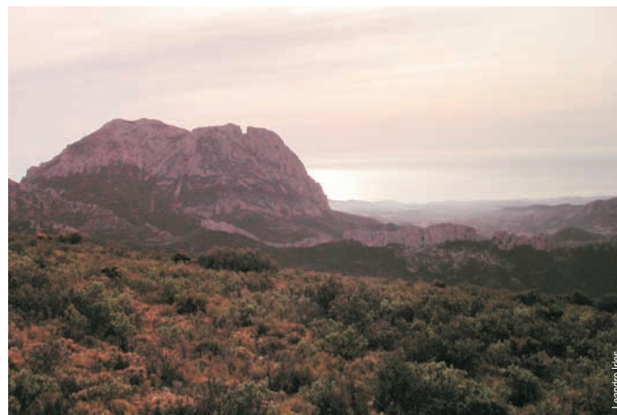
Vista del Puigcampana hacia el mar