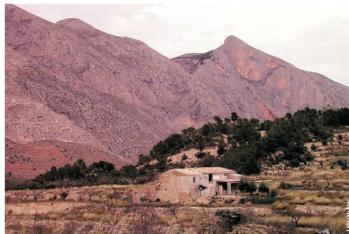
Casa en el alto de Tafarmatx, Sella