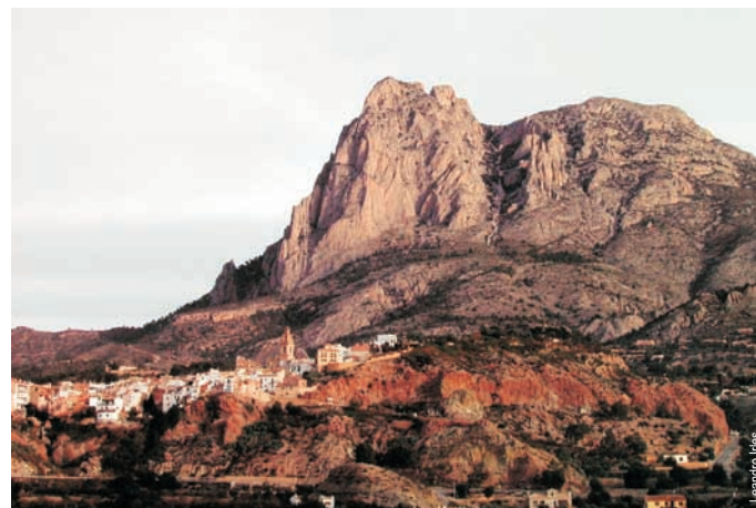
Vista de Finestrat y del Puigcampana