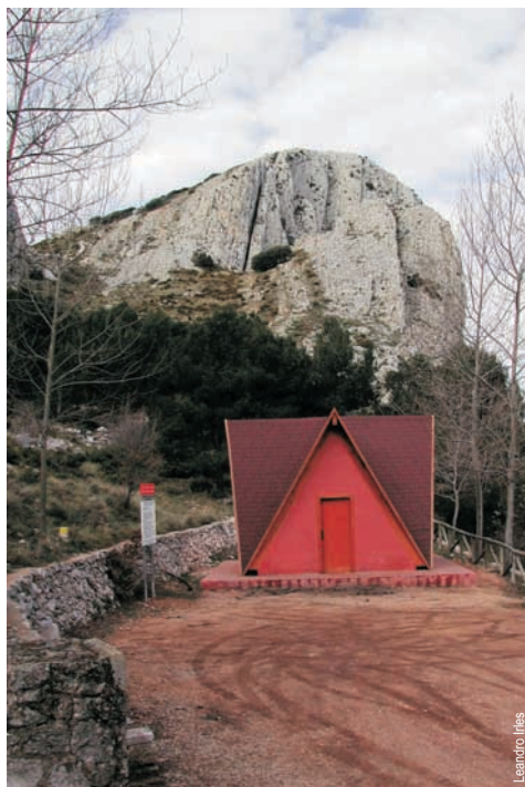
Refugio de la Font dels Teixos y la cumbre de la Xortà.

comarca: la Marina Baixa y la Marina Alta recorrido: 15,8 km tiempo: 5 h 30' dificultad: media cartografía: 1:50.000 Alcoy 821 (29-32) · Benissa 822 (30-32) entidad promotora: Diputación de Alicante