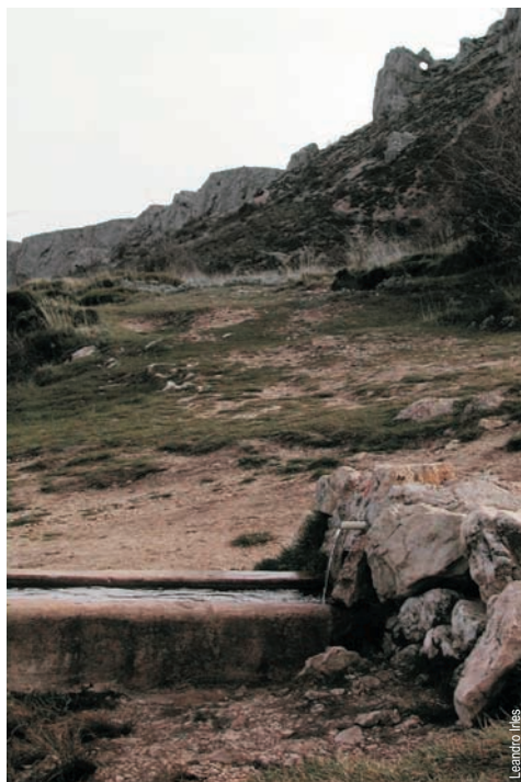
La font Forata, a la serra d'Aitana

entidad promotora: Diputación de Alicante