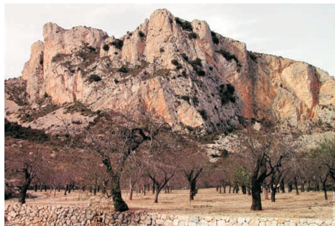
Paraje de la fuente de Partagàs, Benifato