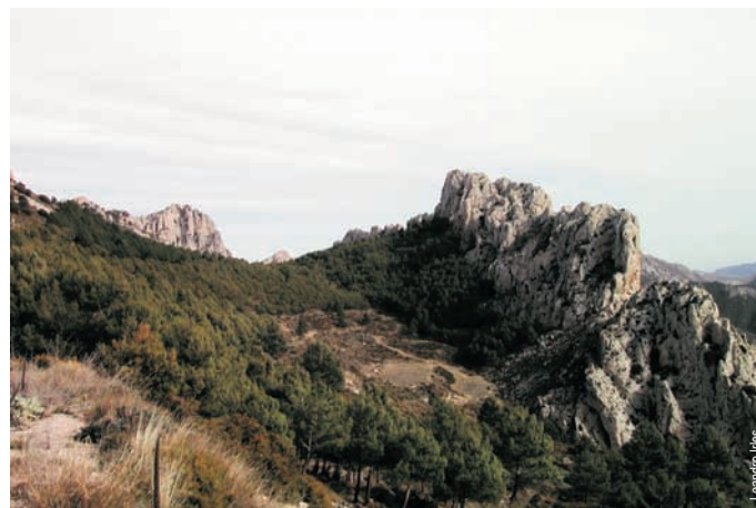
Vista dels Bardals y del pla de la Casa, en la Serrella