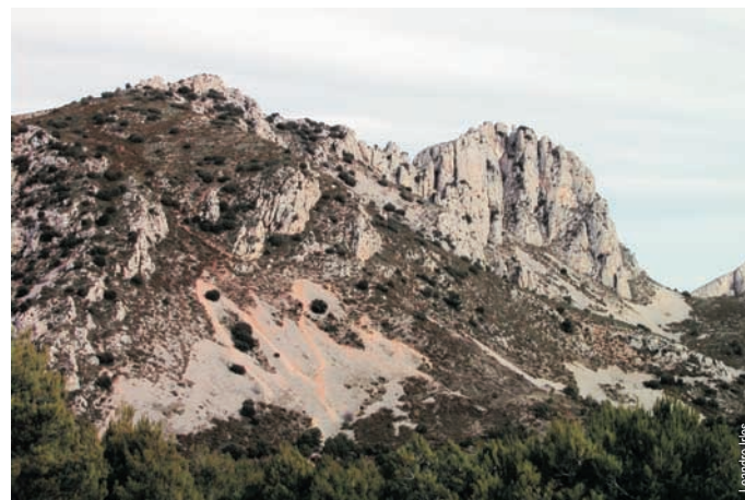
Cumbre del pla de la Casa y la sierra de Serrella