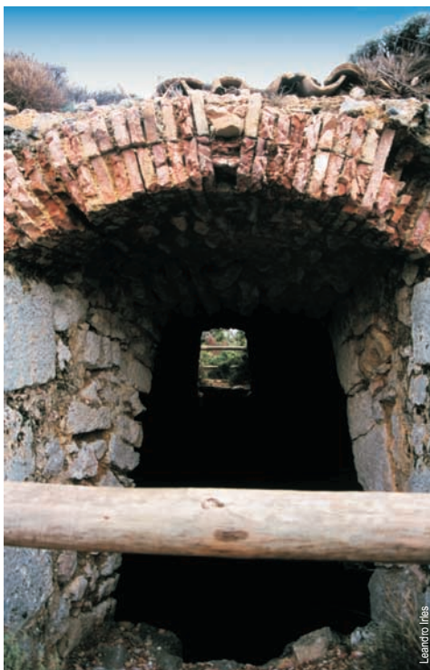
Cava del Canyo, Ibi

entidad promotora: Diputación de Alicante