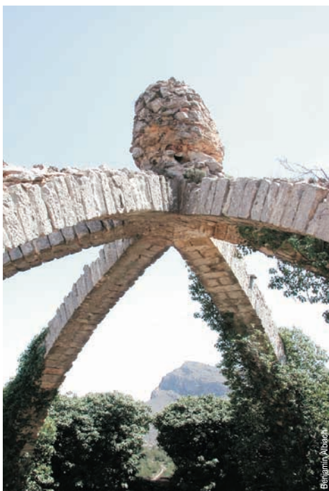
La cava Arquejada, Agres

entidad promotora: Centro Excursionista de Agres