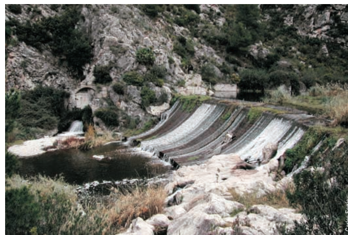
Azud en el río Serpis, Lorcha