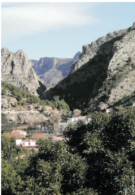
Fonts de l'Algar, Callosa d'en Sarrià