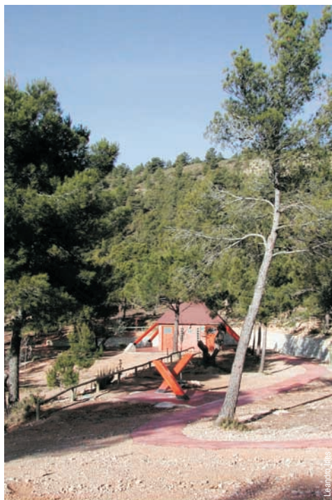
Àrea recreativa Lomas de Jara o Buenos Aires, Biar

entidad promotora: C. Excursionista de Biar