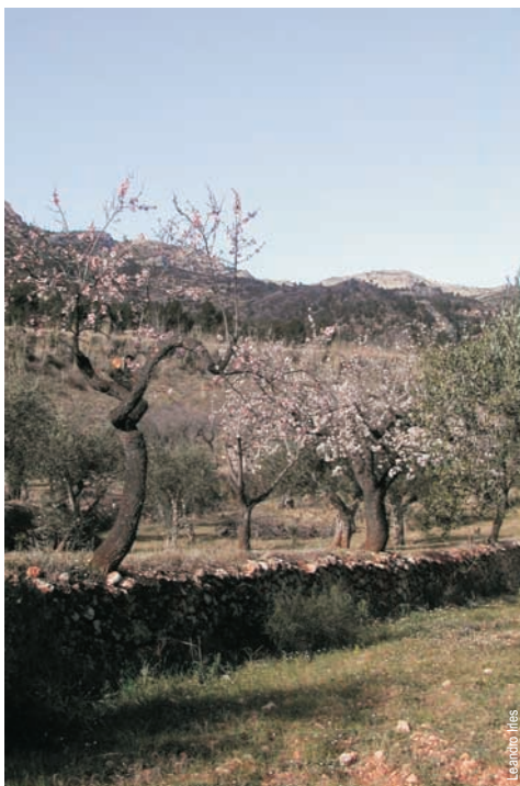
Cultivos y vista del Montcabrer, Muro d'Alcoi

entidad promotora: C. Excursionista de Muro