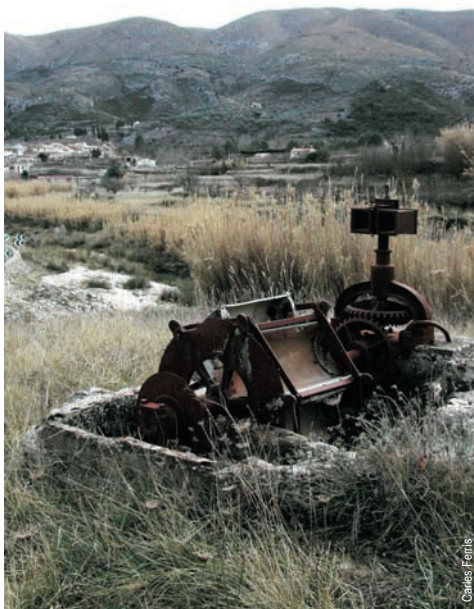
Noria de Vall de Ebo

entidad promotora: Centro Excursionista de Pego