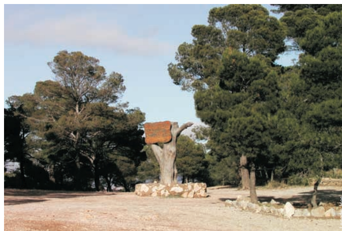
Área recreativa Balcó d'Alacant, Tibi