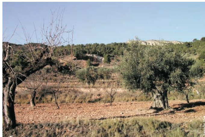
Cultivos típicos de la zona, Castalla