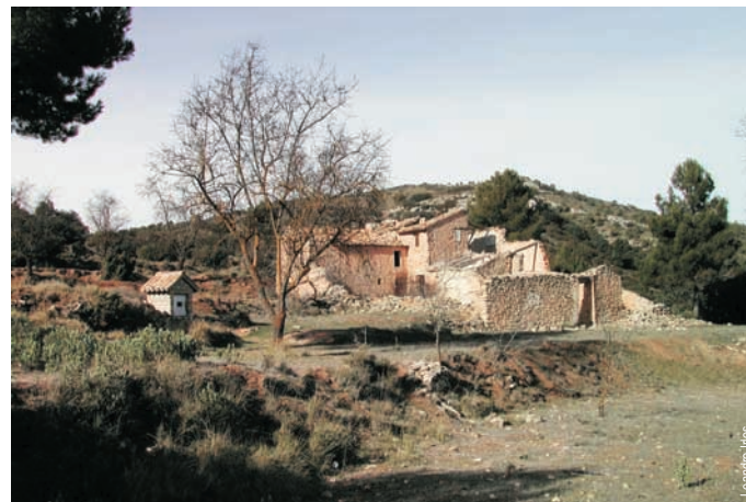
Casa y fuente de la Fondoma, Onil