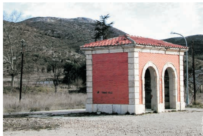
Apeadero de Agres, antigua vía de ferrocarril Yecla-Alcoy