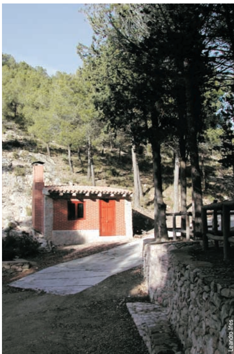
Área recreativa Font de Vivens, Jijona

entidad promotora: C. Excursionista de Jijona