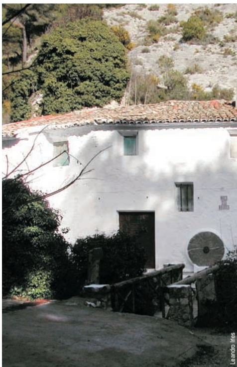
Molino en el barranco de los Molinos, Ibi