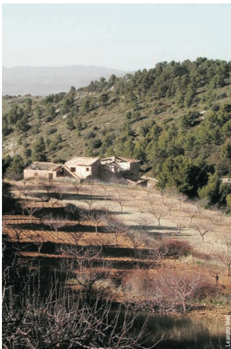
Mas del Carrascar d'Anselmo, Ibi

entidad promotora: C. Excursionista Colivenc