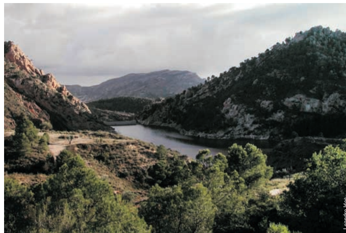
Pantano de Tibi