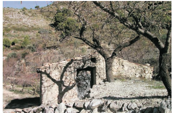
Bancales de Benioplà, Tàrbena