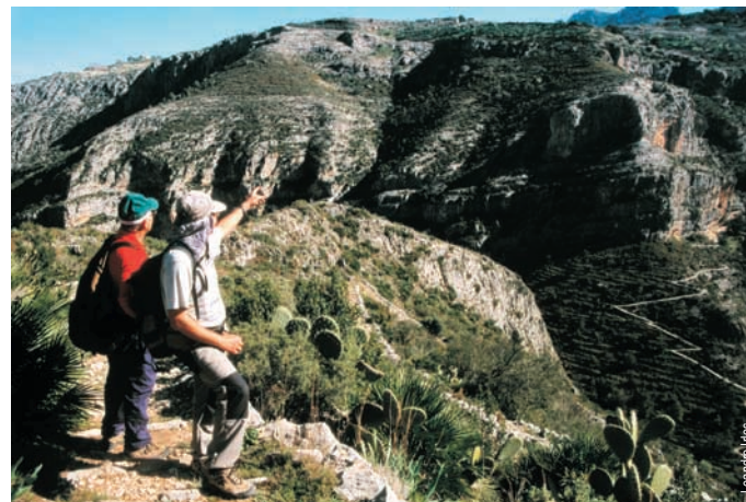
La catedral del senderismo, zig zag escalonado, la Vall de Laguar