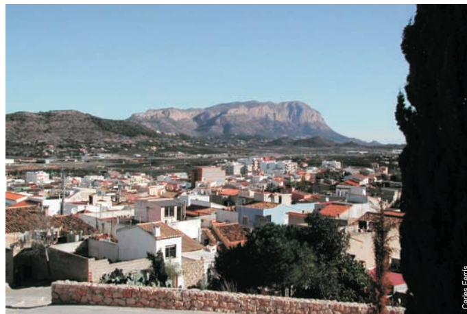
El Montgó desde Pedreguer