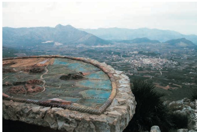
Mirador del Coll de Rates, Parcent