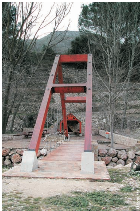
Área recreativa Font dels Noguers, Famorca

entidad promotora: Diputación de Alicante