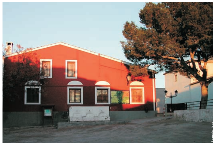
Albergue municipal de Orito, Monforte del Cid