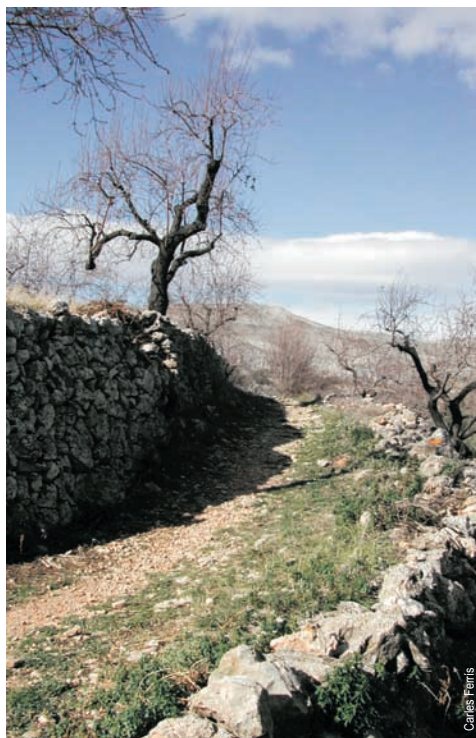
Camino entre cultivos, la Vall de Laguar

entidad promotora: Ayto. de La Vall de Laguar