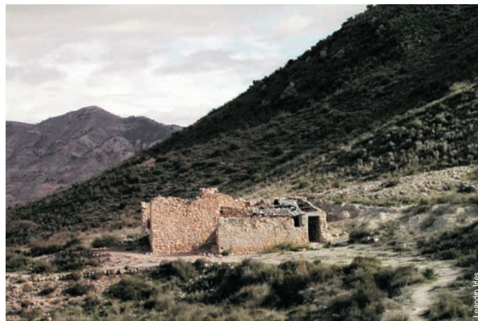
Casa Noé, Elda