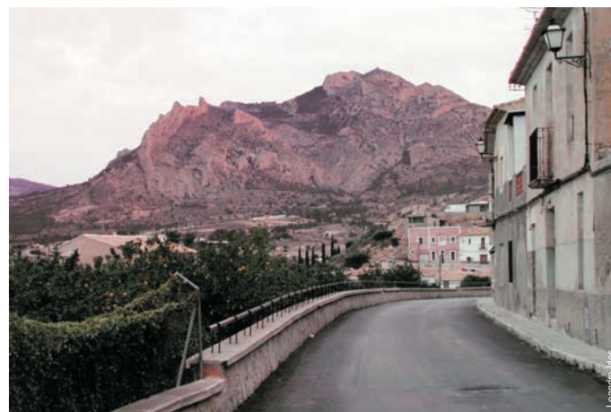
Busot y sierra del Cabeçó d'Or