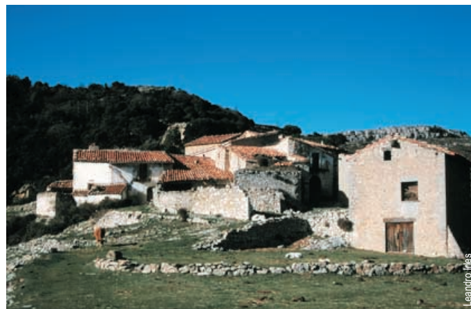
Mas d'en Segures