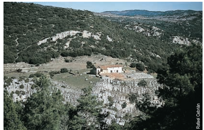
Mas de Sinfores, camino de Bel a Castell de Cabres