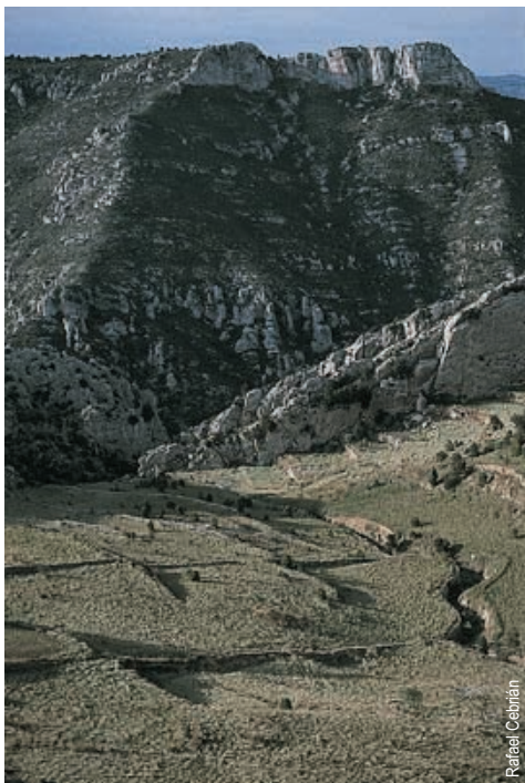
campos de Bel

entidad promotora: Centro Excursionista de Castellón