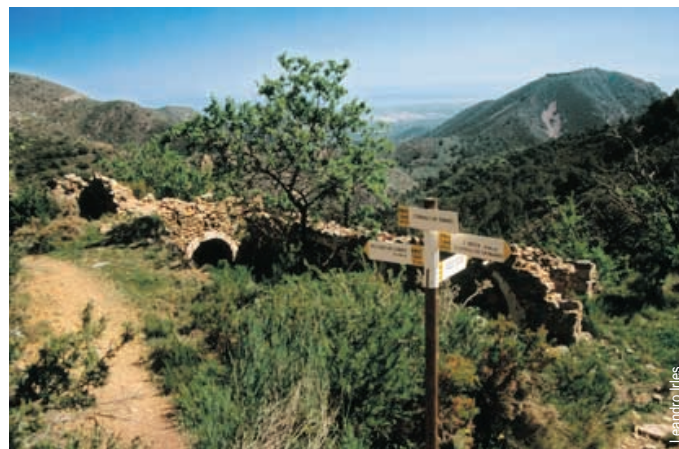
Corrales del Turmo