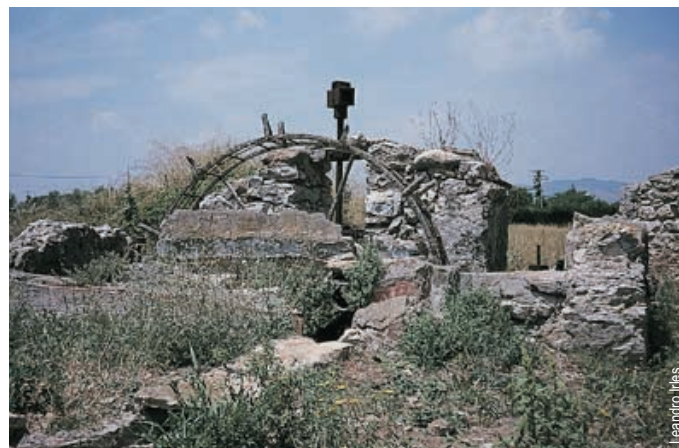
Noria de agua, Sant Mateu