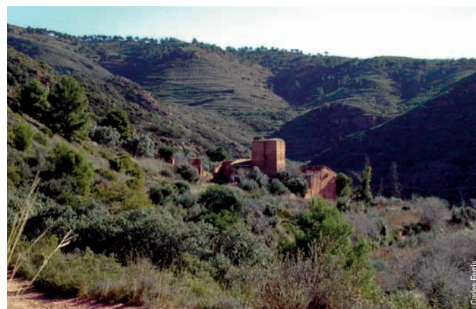
Aldea morisca de l'Olla, Marines, a los pies del Gorgo