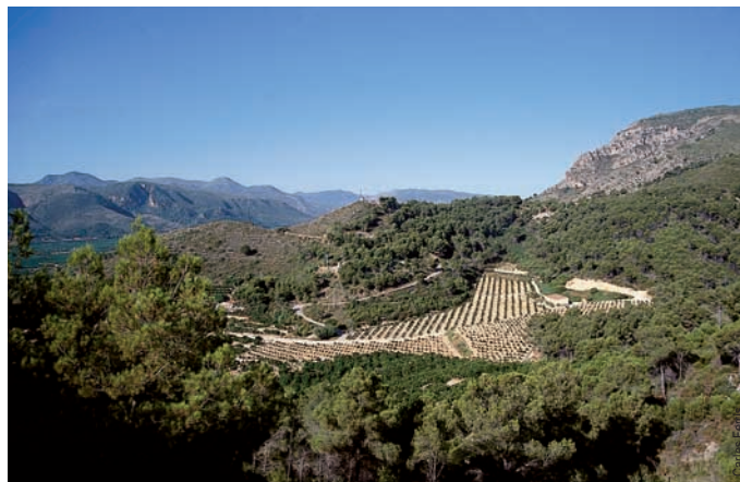
Vista de la ermita de Sant Llorenç desde el Mirador de Tavernes