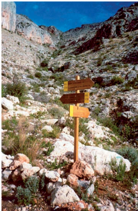
Senda dels Amoladors, Tavernes

entidad promotora: C.Exc. Tavernes de la Vallidigna