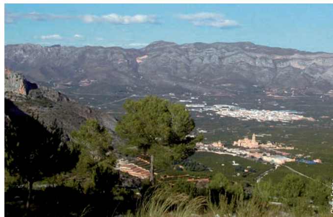
La Valldigna y el Monasterio de Santa María desde Barx