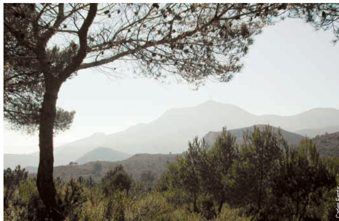
El Montdúver desde el camino de Tavernes a les Foies