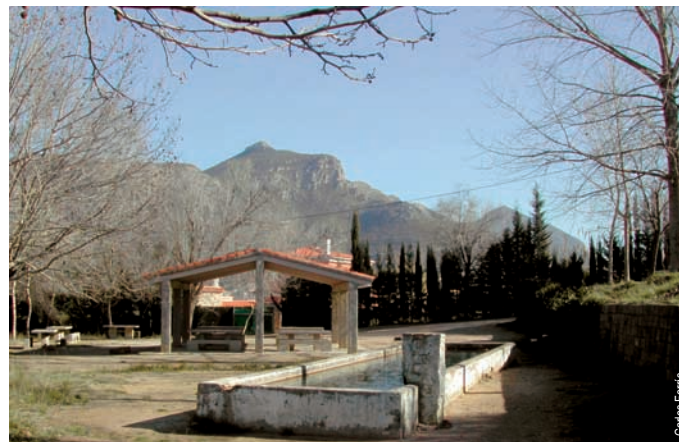
Área recreativa de la Puigmola, Barx