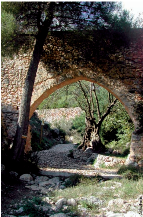
Acueducto de Ròtova

entidad promotora: C.Excursionista de Ròtova