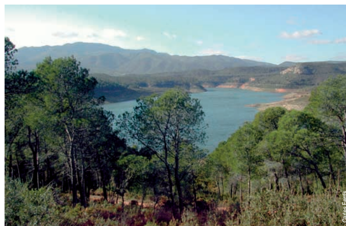
Embalse de Forata y sierra Martés, Yátova