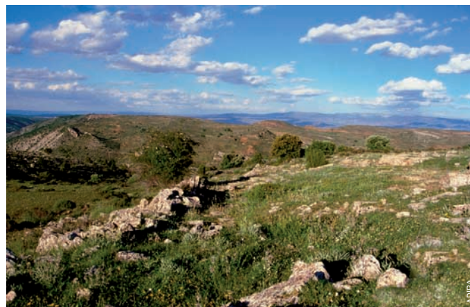
Camino de las Navas a arroyo Cerezo, Castielfabib